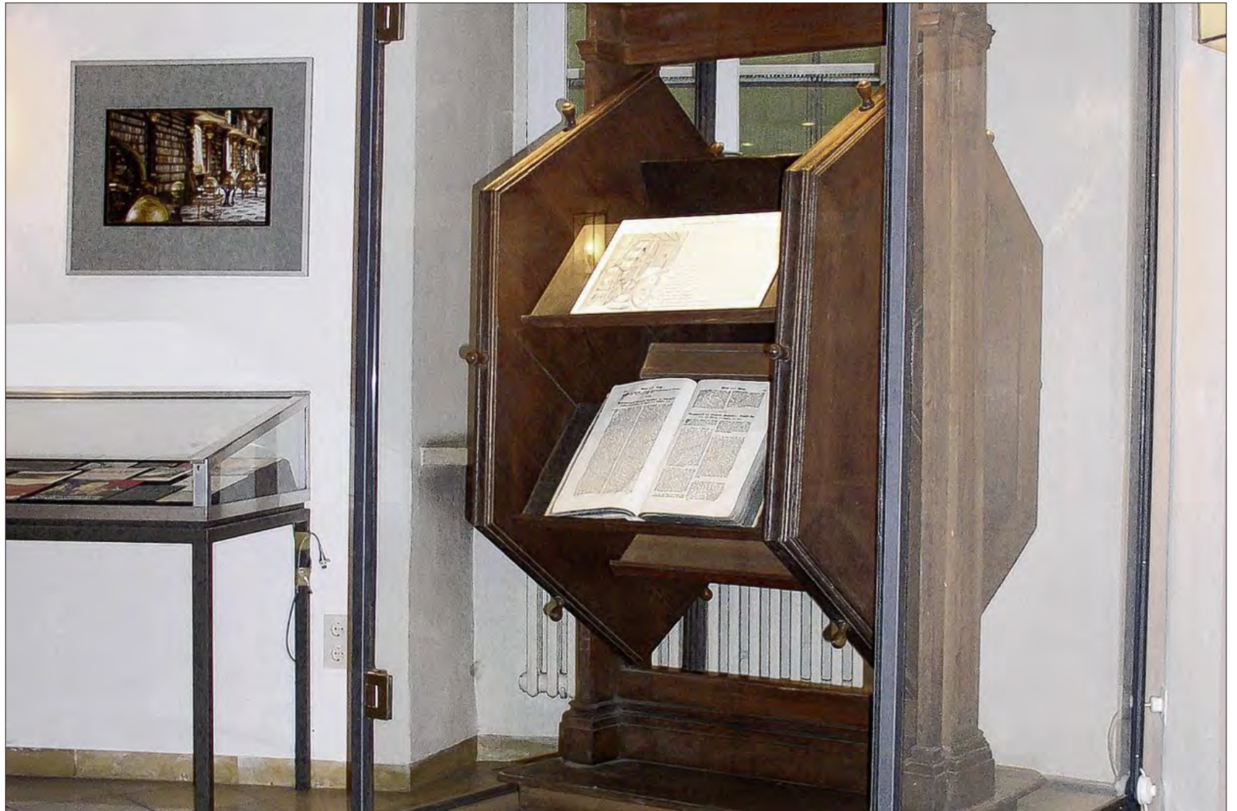
Das Bücherrad aus St. Emmeram